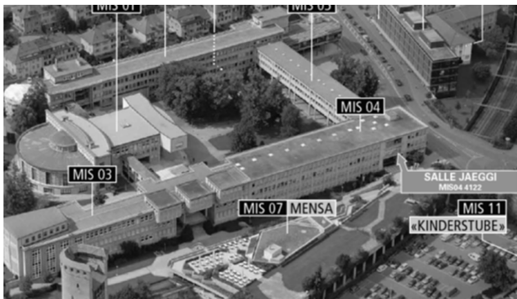
Université Miséricorde, MIS04 4112, Salle Jäggi

Einführungssitzung für neue Philosophiestudierende Mittwoch, 16. September 2015, 17.15 Uhr